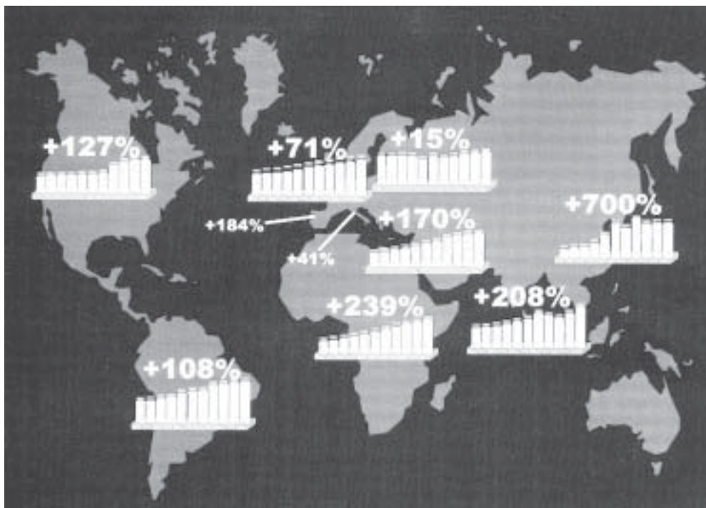
Figura 1. Evolução da produção mundial de revestimentos por área geográfica - de 1990 a 2000.

cerâmica chinesa, esclarecemos que os dados apresentados são os oficiais fornecidos pelo ministério responsável, posteriormente confirmados por pesquisas de mercado in loco , e também pelos fornecedores de equipamentos que atuam nesse mercado há anos. A China produzia em 1990 200 Mm 2 de revestimentos. Atingiu seu pico de produção em 1997 com quase 1842 Mm 2 , posteriormente sofreu uma queda e estabilizou nestes 3 anos em 1600 Mm 2 . O crescimento foi de 700%. Na China existem 2500 empresas produzindo revestimentos, obviamente nem todas com produção do tipo industrial, mas se estima que cerca de 10% destas se situem em uma faixa de produto elevada para os padrões chineses.